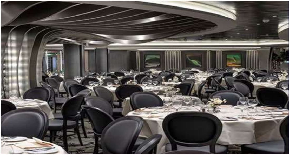
Colorado River (main restaurant): เพลิดเพลินกับอาหารรสเลิศในร้านแบบ fine dining และ à la carte