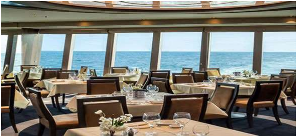
Green Orchid (main restaurant): ร้านอาหารที่ใหญ่ที่สุดให้บริการอาหารนานาชาติและยังมีร้านอาหารพิเศษให้ท่านได้เลือกรับประทานอีกหลากหลายสไตล์ (มีค่าใช้จ่ายเพิ่มเติม)