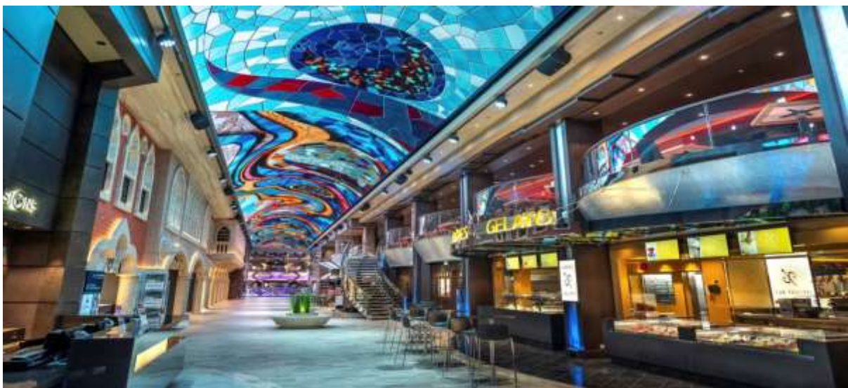
Go Cruise - QQCRCPH-MS019 - Copenhagen, Denmark-Flaam-Alesund-Hellesylt, Norway - Kiel, Germany