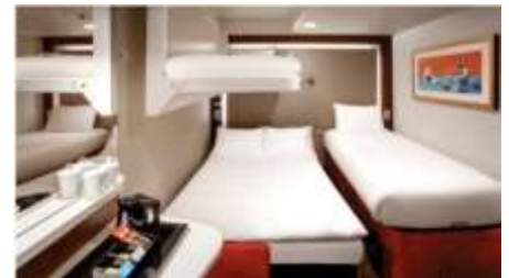
พัก 3-4 ท่าน