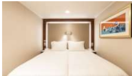
พัก 1-2 ท่าน

From 13 - 14 sq.m Max Occupancy 2-4 ^ Deck 5/8/9/10/11/12/13/15 2 Single Beds / 2 Single Beds + 1 Ceiling Pullman Bed / 1 Single Bed + 1 Pullman Bed + 1 Double Sofa Bed