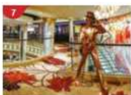
7 Johnnie Walker House™ Immerse yourself in the intricate world of premium Scotch whisky.