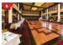
6 Dream Dining Room Savour a wide variety of Asian and international cuisine.