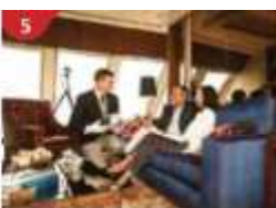
5 The Palace Indulge in European-style butler service and exclusive facilities.