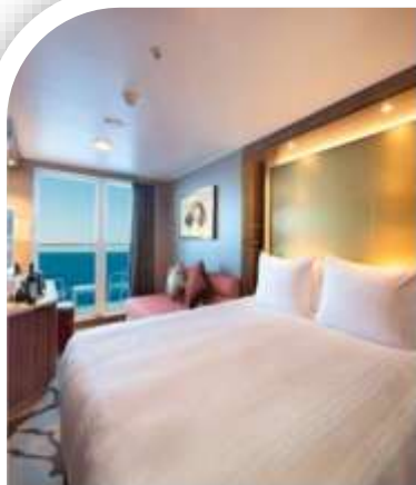
Oceanview Stateroom with Balcony