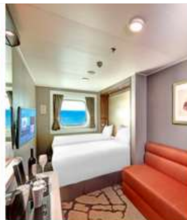
Oceanview Stateroom with Window