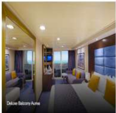
Deluxe Balcony Airea