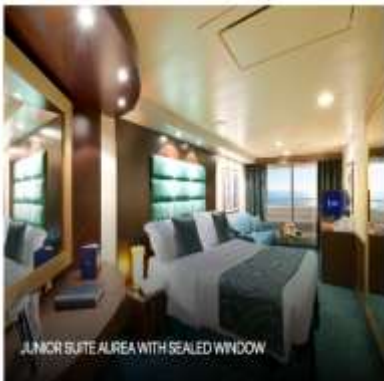
JUNIOR SUITE AIREA WITH SEALED WINDOW