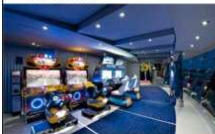
VIDEO GAMES ARCADE