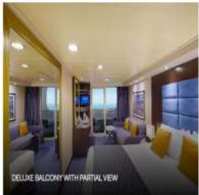
DELUXE BALCONY WITH PARTIAL VIEW