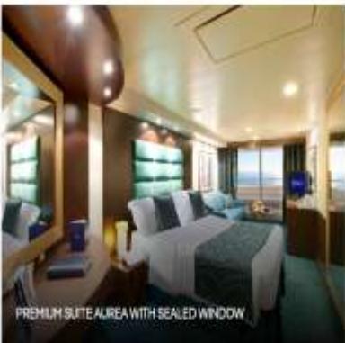
PREMIUM SUITE AIREA WITH SEALED WINDOW