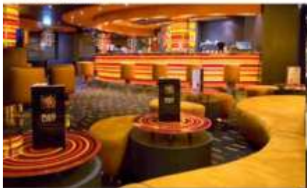
GOLDEN JAZZ BAR