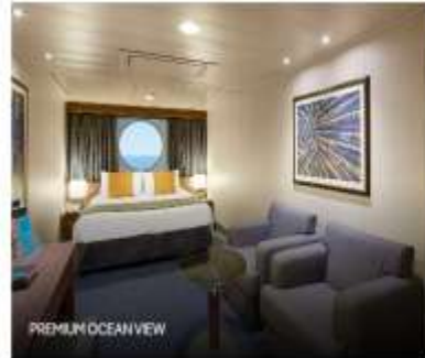
PREMIUM OCEAN VIEW