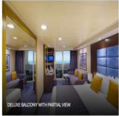
DELUXE BALCONY WITH PARTIAL VIEW