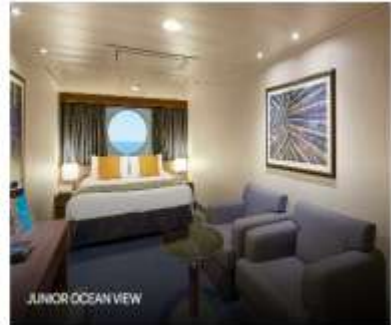
JUNIOR OCEAN VIEW