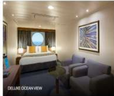
DELUXE OCEAN VIEW